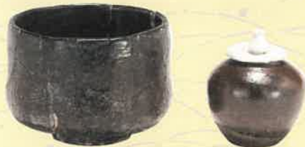
堺環濠都市遺跡出土 茶碗・茶入 (堺市文化財課蔵)