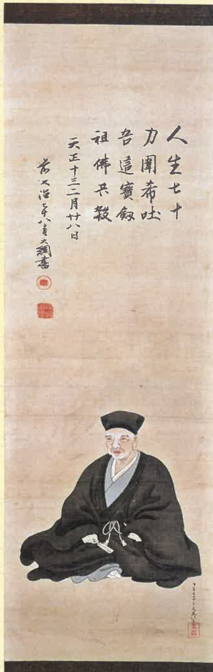
千利休画像