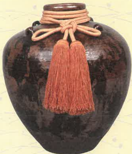
瀬戸茶壺(堺市博物館蔵)