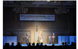
(カンボジアの宮廷舞踊)