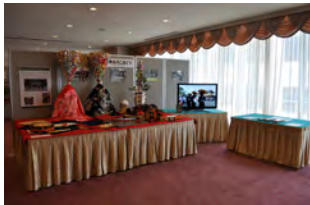
(上神谷のこおどり展示)

大阪府や堺市に関わりの深い文化遺産の紹介：人形浄瑠璃文楽・堺式手織緞通・上神谷のこおどりなど