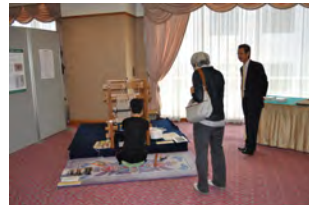
(堺式手織緞通の実演)