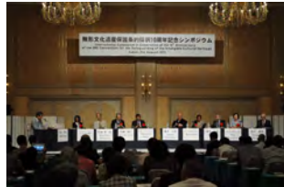
(パネルディスカッション)