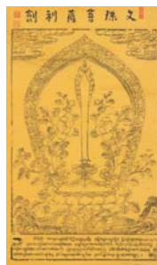
サムイェー寺の護符*