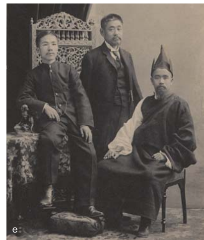
a. 河口慧海の明治35年(1902)の日記 b. 中村不折筆「雪山」扁額 c. 鉱物標本 d. 『西藏旅行絵巻』第2巻(部分) e. 右から河口慧海、井上円了、大宮孝濤 (明治35年(1902)、インド・カルカッタにて撮影)