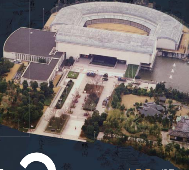
開館当時の 堺市博物館

Let's Explore Treasures of The Museum! From the collection of Sakai City Museum -- Part 2: People and Landscape