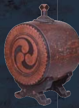
漆塗太鼓形酒筒 [国重要文化財]