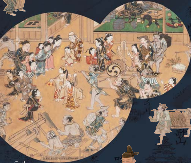
月次風俗諸職図屏風 (部分)