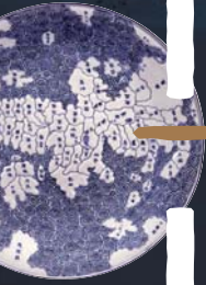
伊万里焼 染付日本地図図皿