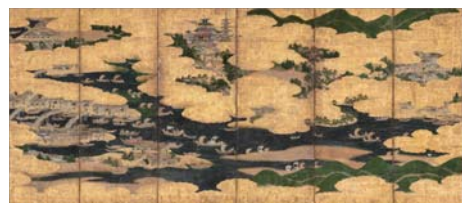
6.「摂津国名所港津図屏風」