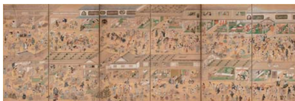
3.「月次風俗諸職図屏風」