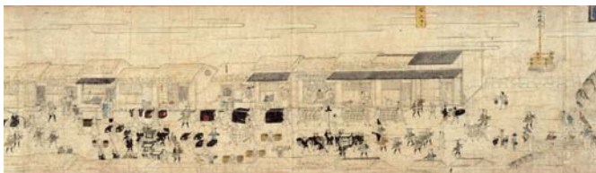
4.「紀州藩参勤交代行列図」