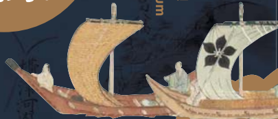
摂津国名所港津図屏風 (部分)