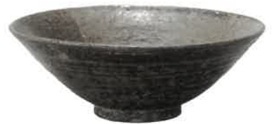
堺環濠都市遺跡出土 高麗茶碗 堺市文化財課