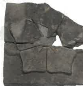
聚楽第周辺武家屋敷跡出土 桔梗文金箔模瓦 京都市考古資料館