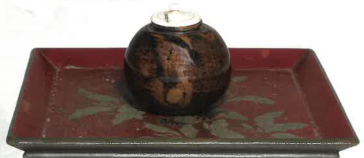
北野茄子茶入 野村美術館