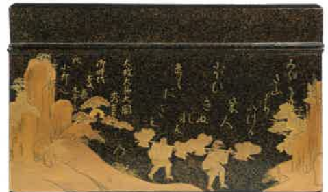
歌時絵香箱 寛永18年(1641)銘 当館