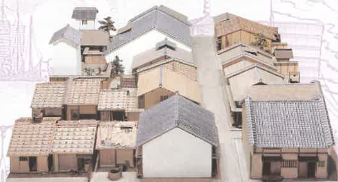
〈街景模型〉 根据屏风画像及发掘文物复原的中世纪末期至 近代初期的街景。(1:20)