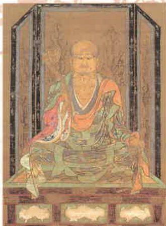
《行基菩萨画像》 出生于堺市的奈良时代高僧， 一生献身于民间传教和社会 事业。