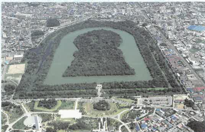
〈仁德陵古坟〉 世界最大面积的古坟。建于5世纪中叶的大王墓。 (陈列相关资料)