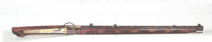
〈庆长大火绳枪(大阪府指定文物)〉 长3米、重135公斤，是世界上最长的火绳枪。