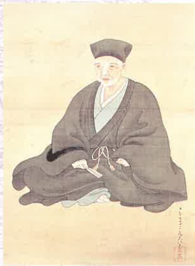
〈千利休画像〉 茶道集大成者， 堺商人之一。