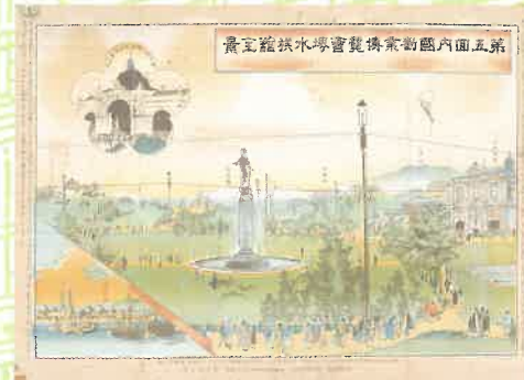
〈堺水族馆全景〉 明治36(1903)年第5届国内实业博览会 时在大滨开馆的水族馆。