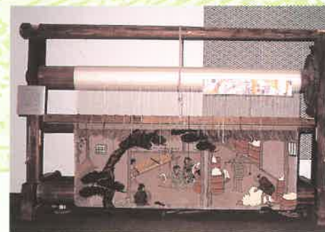
〈堺缎通织机〉 缎通是类似地毯的铺设用品，明治时期 曾大量出口到美国等国家。