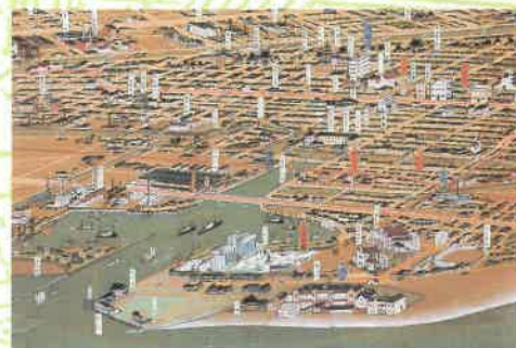
〈堺市鸟瞰图(堺港部分)〉 “大正广重”吉田初三郎所画的全景立 体画图(1935年)