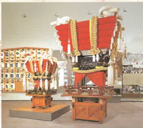
《蒲团大鼓》 在秋季祭典上，市区南部有许多花车张灯 结彩，北部则主要抬蒲团大鼓游行。