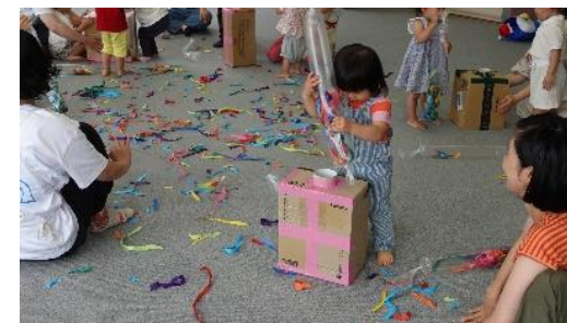
おやこクラブにおける芸術家派遣事業