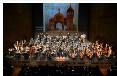
堺市文化芸術活動応援補助金採択事業