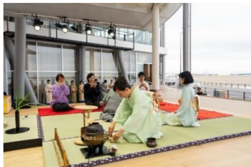
万博における茶の湯文化の魅力発信の様子