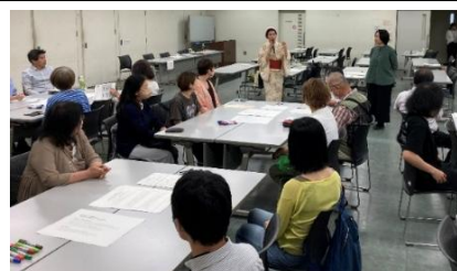
堺アートカウンシル交流会