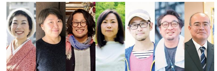
堺アーツカウンシルプログラム・ディレクター、オフィサー