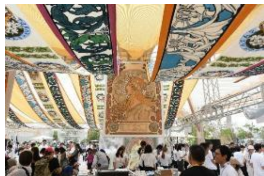
万博におけるアルフォンソ・ミュシャ作品の魅力発信の様子