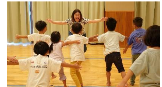
学校園における芸術家派遣事業