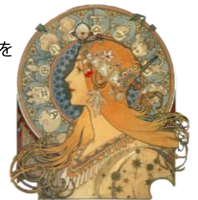
アルフォンス・ミュシャ・コレクション