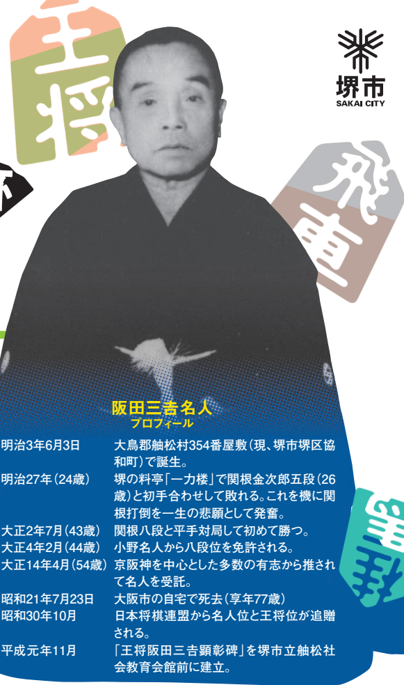
阪田三吉名人 プロフィール