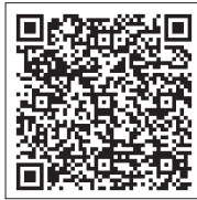
堺市電子申請システム

https://lgpos.task-asp.net/cu/271403/ea/residents/procedures/apply/f10e45da-7a39-45b5-832f-a5f7c68691cc/start