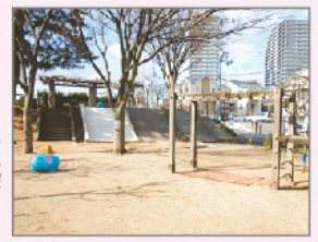
南野田すかしゆり公園