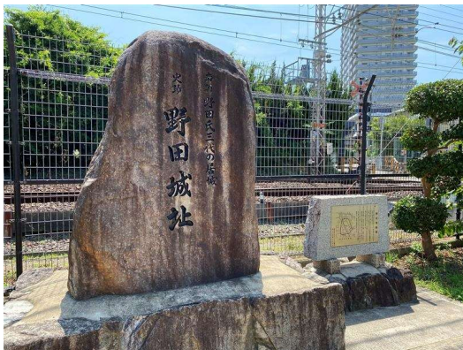
タイトル：野田城址 場 所：野田校区 時 期：令和5年6月