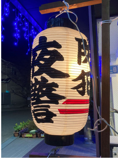
タイトル：防犯提灯 場 所：南八下校区地域会館 時 期：令和5年12月28日