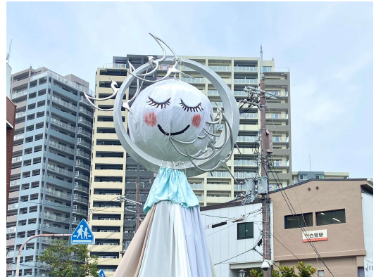
タイトル：あした、天気になあれ！ 場 所：白鷺駅前 時 期：令和5年6月

白鷺駅に降り立つと目の前に巨大なてるてる坊主が！ 可愛い坊主もたくさん飾られて、心が晴れやかになりました。 しらさぎ310商友会の皆様が大阪公立大学の学生や障害者施設 の方の協力を得て4年ぶりに開催されたそうです。