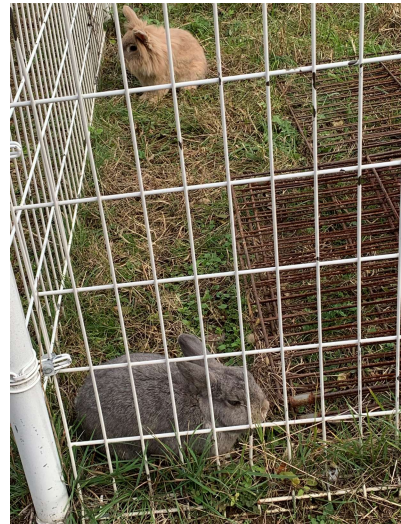
タイトル：あずきときなこ 場 所：野田小学校 時 期：令和4年12月 野田小学校のマスコットうさぎ「あずき」と「きなこ」の ツーショットです。 いつもあずきがきなこを追いかけまわしていたそうです。 令和5年にあずきはお空に飛びたってしまったようで、 気のせいかもしれませんがきなこは少し寂しそうにしていました。