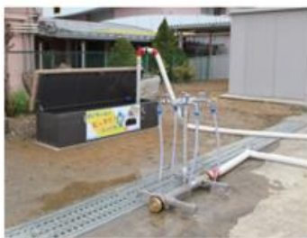
すいちゃんのピックリじゃぐち (災害時給水栓)