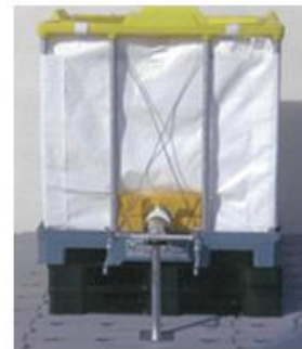
組立て式簡易給水タンク