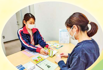
妊娠期からの相談