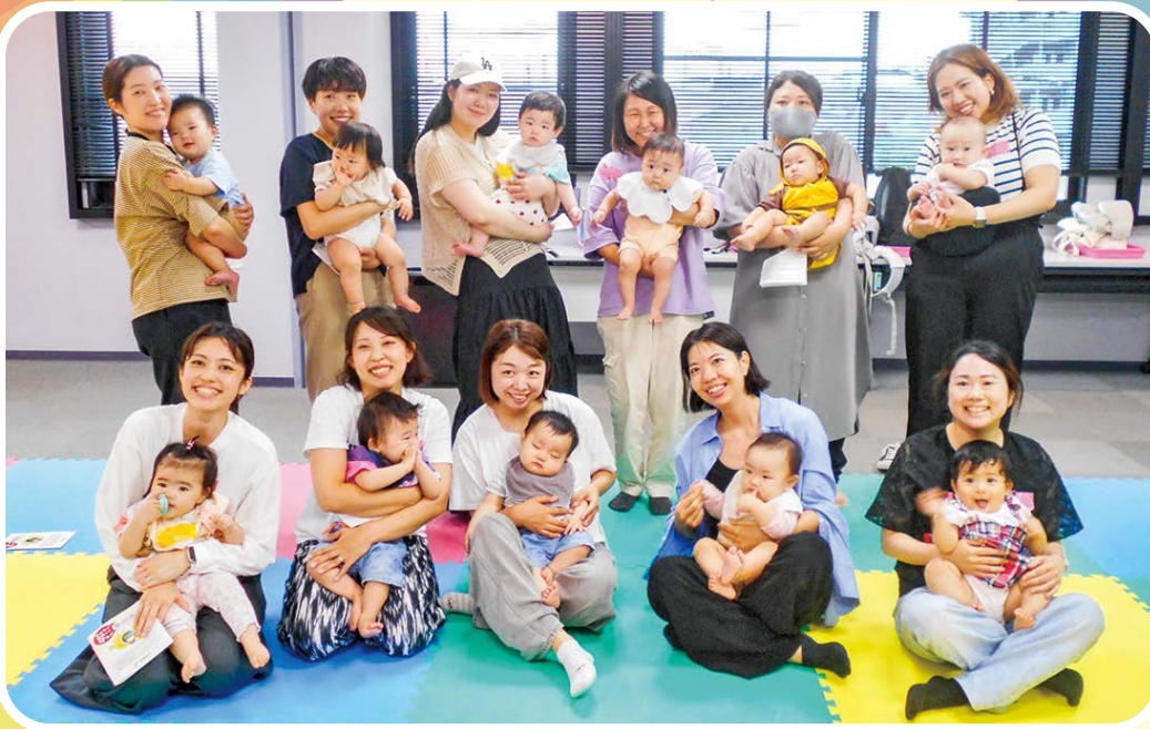
※第一子の子育てママを対象とした交流会