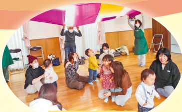
子育てサークル・サロン