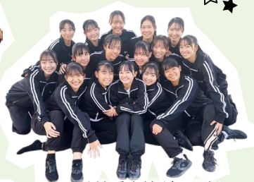
登美丘高校ダンス部