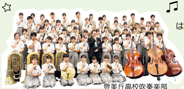
登美丘高校吹奏楽部