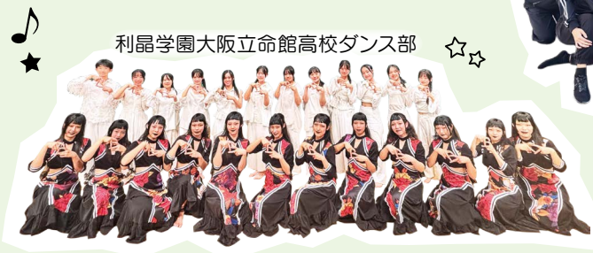
利晶学園大阪立命館高校ダンス部