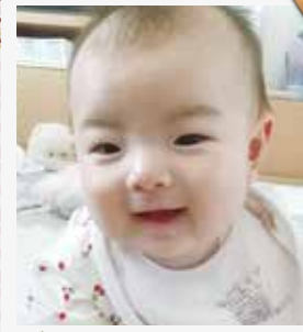
りほ 凜歩ちゃん 3か月