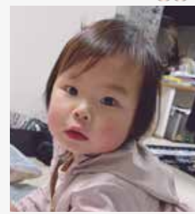
なゆ 凧結ちゃん 1歳3か月