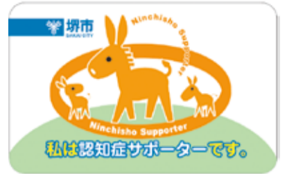
認知症サポーターカード