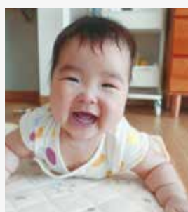
わと 芭都ちゃん 6か月

赤ちゃんの写真を再募集します!皆が「思わず笑顔になる」写真、お待ちしております!