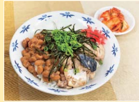
ひばり丼(材料 納豆、サバ水煮缶)