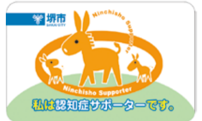
認知症サポーターカード