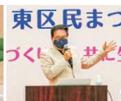
東区シンポジウムの様子