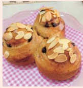
カフェチョコぐるりん

直接かほかき、FAX、電子メールで住所、氏名、電話番号、年齢、希望講座名、何を見て知ったかを6月10日(必着)までに、東文化会館(〒599-8123 東区北野田1077-301 アミナス北野田 3階)へ。