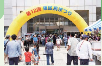
昨年の区民まつり

東区の皆さんの親睦や交流、連帯を深めることを目的に開催します。子どもから大人まで楽しめる企画が満載です。皆さん、ぜひご来場ください。入場無料(販売品は有料)。直接会場へ。