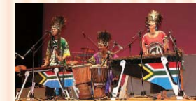
ンコシ・アフリカ