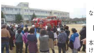
レスキュー車がやってきました