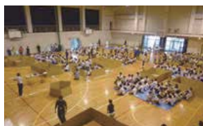
中学生も訓練に参加