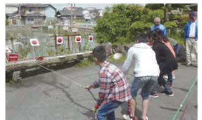
ジュニア防災リーダー育成研修会

中学生と地域の皆さんが力を合わせた避難所の開設訓練、自治会未結成地域との合同訓練、また、防災リーダー育成を兼ねた活動などさまざまな取り組みが実施されています。今年度は、東区初の試みとして小・中学生のファシリテーター育成を目的とした、実施訓練と講習による「ジュニア防災リーダー育成研修会」を実施し、防災技能の向上が図られました。