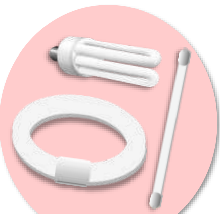
Đèn huỳnh quang (ngoại trừ đèn LED, Halogen)

Đối tượng phân loại, thu hồi (địa điểm) là các sản phẩm sau đây được thải ra từ hộ gia đình.