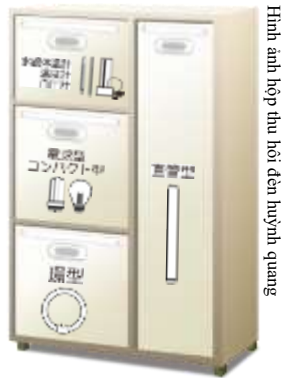
Hình ảnh hộp thu hồi đèn huỳnh quang

Vui lòng bỏ vào hộp thu hồi đặt tại các siêu thị hợp tác hoặc cơ sở công cộng trong thành phố.