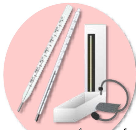
Thân nhiệt kế, nhiệt kế, huyết áp kế có sử dụng thủy ngân