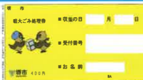
Amostra de um selo da taxa de coleta do lixo de grande porte

Principais locais onde são vendidos os selos da taxa de coleta: Seven Eleven, Circle K Sunkus, Family Mart, Lawson, Daily Yamazaki, Ministop, am/pm, Coco store, Cooperativa agrícola, Centro de Serviço Ferroviário Semboku, Heart In, All One e outros.