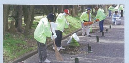
닌토쿠릉 수호대가 펼치는 청소활동

그야말로 도심의 오아시스입니다. 아이들과 손자 손녀를 위해서라도 소중히 보존해 가고 싶습니다!