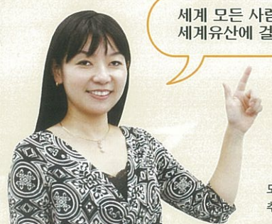
모즈·후루이치 고분군 세계문화유산 추진본부회의사무국 담당자