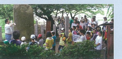
후루이치 고분군 탐험프로젝트

옛날 사람들은 분구를 사토야마(=생활과 밀접한 야산)로 이용하거나, 해자의 물을 논에 대거나 하면서 오랫동안 고분과 함께 살아왔습니다. 고대로부터 유구한 역사 속에서 사람들의 생활 속에서 존재해 온 고분을 체험하면서 아이들은 그 가치를 배우고 있습니다.