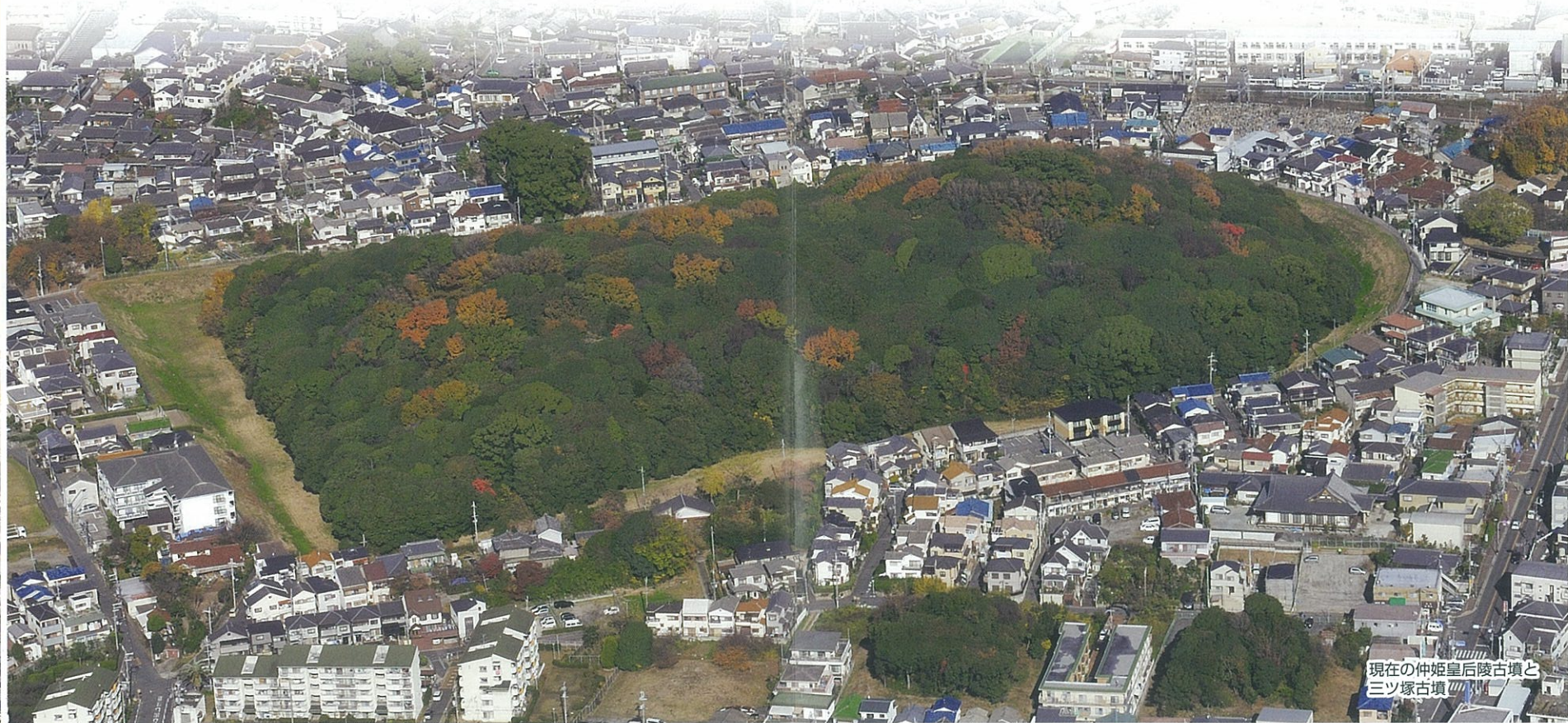
現在の仲姫皇后陵古墳と三ツ塚古墳