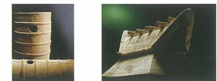
차야마유적출토 원통 토우 구리즈카 고분 출토 집모양 토우

A4 현재는 무성한 숲이지만 축조 당시에는 나무가 없었습니다. 분구의 경사면에는 돌이 깔려 있었습니다. 이것은 '후키이시(=좁석)'이라 부릅니다. 분구의 평탄한 곳에는 점토를 구워서 만든 토우가 규칙적으로 나열되어 고분을 장식하고 있었습니다.