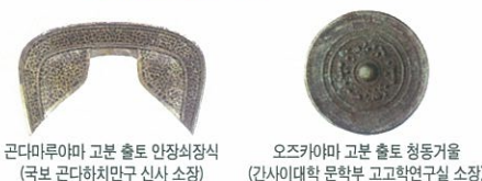
콘다마루야마 고분 출토 안장쇠장식 (국보 콘다히치미구 신사 소장) 오사카야마 고분 출토 청동거울 (간사이대학 문학부 고고학연구소 소장)

A2 고분에는 사자(死者)가 매장되어 있습니다. 관에 넣어진 유체 외에 사자의 신변 물품이 함께 보관되어 있습니다. 사자의 장례 의식에 사용된 토기와 장식품, 거울이나 무기 등 사자의 신분과 직업, 시대에 따라 여러 가지 부장품이 있습니다. 그 중에는 매우 귀중한 것도 있으며 외국으로부터 온 도래품도 있습니다.