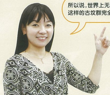
百舌鸟·古市古坟群 世界文化遗产推进本部会议事務局 负责人

所以说，世界上无论是谁看了都会觉得很震撼！这样的古坟群完全有资格成为世界遗产啊！