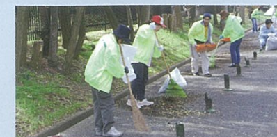
仁德陵保护队开展的清扫志愿者活动