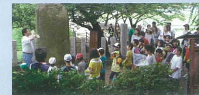
古市古坟群探险项目