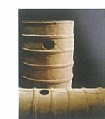
茶山遗址出土的圆筒陶俑

A4 现在为茂密的森林,但建造之时则寸木不生。坟丘的斜面铺着石头,这种石头称作“葺石”。坟丘的平坦之处有规则地摆放着粘土烧制的陶俑,点缀着古坟。