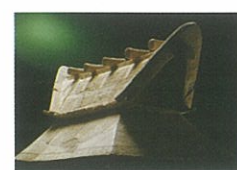
栗冢古坟出土的屋形陶俑