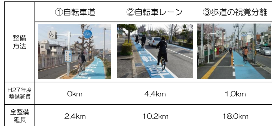
歩行者、自転車、自動車を分離した整備方法