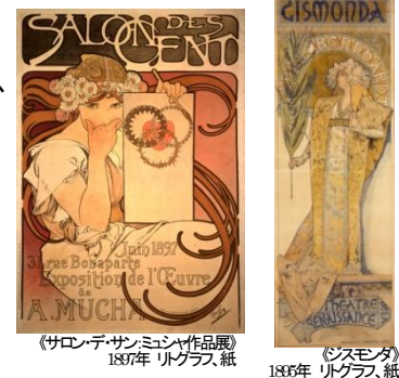
《サロン・デ・サン・ミュシャ作品展》 1877年 リトグラフ、紙

文化館へのアクセス案内の充実や館外でのPRを積極的に行うことで、アルフォンス・ミュシャコレクションの優れた価値や魅力を市内外に広く発信する。