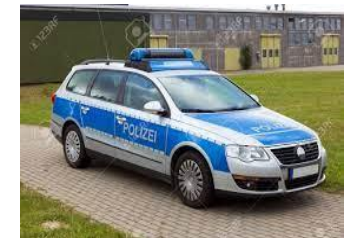
ドイツのパトカー