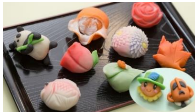
和菓子作り体験 （30,000 円以上の寄附）