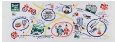
SAKAI 街マップ 手ぬぐい （10,000 円以上の寄附）