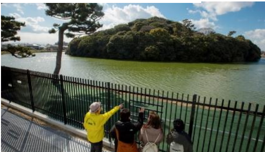
ガイド・VR 体験付古墳周遊ツアー （50,000 円以上の寄附）