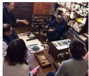
和包丁作り体験 （50,000 円以上の寄附）