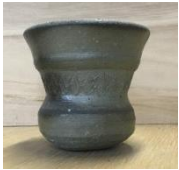
須恵器 タンブラー