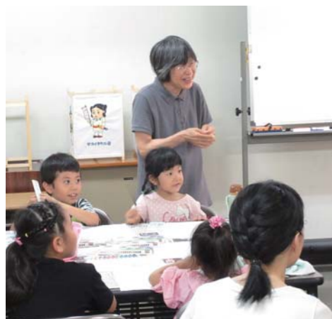
今年も行灯作りが始まります。