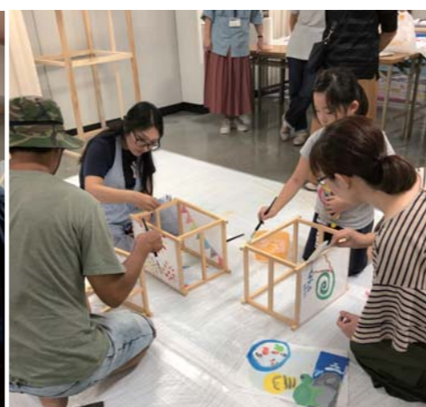
行灯の枠四面に絵を貼って完成させます。