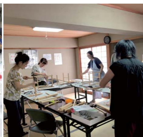
小さな行灯の枠作りが奮闘中。