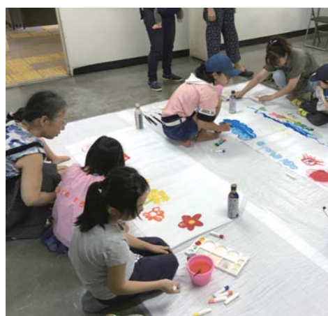
大きな行灯の絵を製作中です。