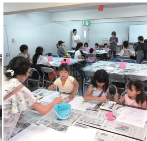
小さな行灯の絵を描こう。