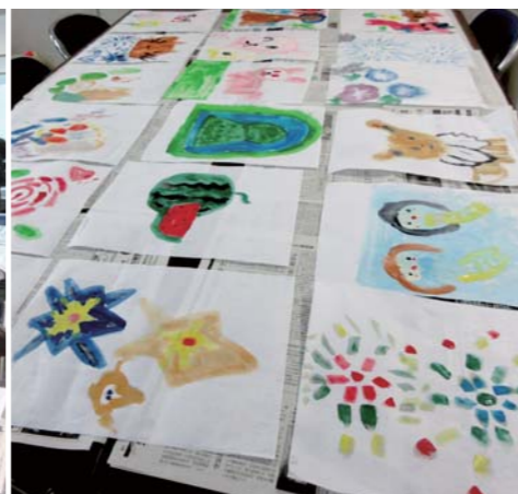
小さな行灯の絵がズラリ。