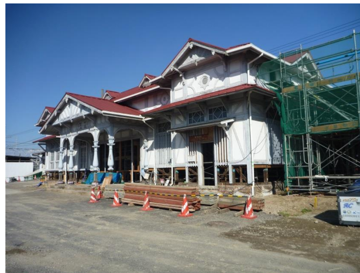
旧駅舎を曳家するための準備工事を実施しています。