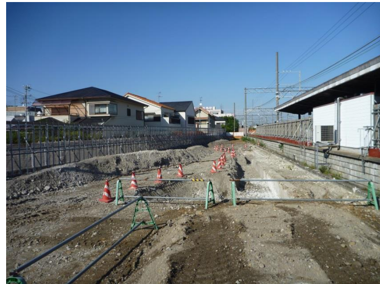
工事ヤードを取り囲む万能塀を設置しました。地中障害物の撤去工事を実施しています。