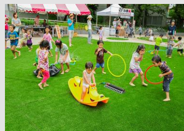
子育て世帯が集い、リラックスする空間 （イメージ）