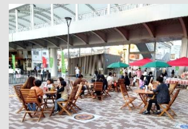
住んでいる・働いている人が憩う空間 （イメージ）