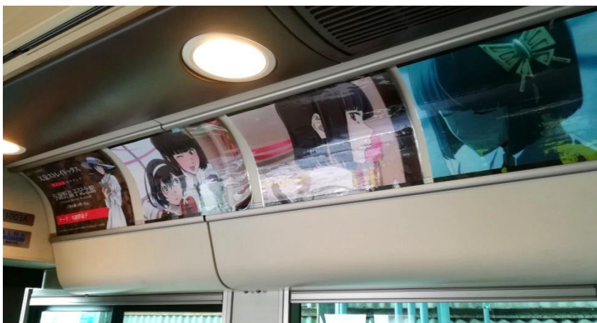
堺トラムでのパネル展