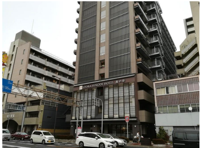
逸の彩（ひので）ホテル