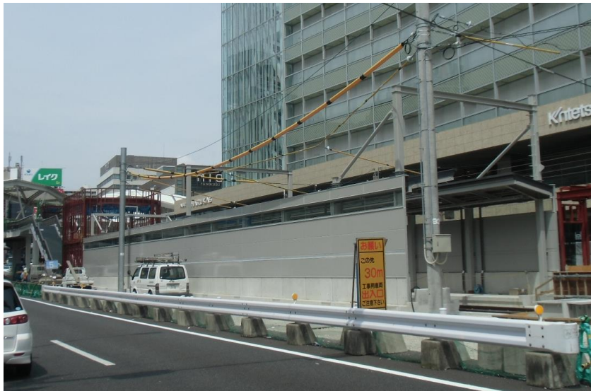
天王寺駅前停留場