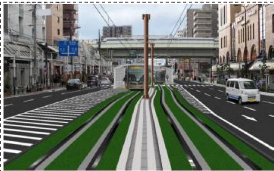
阿倍野停留場 工事完成イメージ