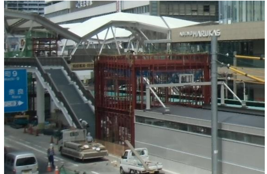
天王寺駅前停留場