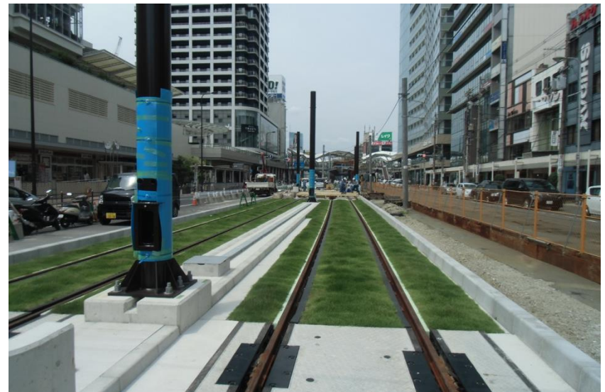
軌道移設（芝生軌道）