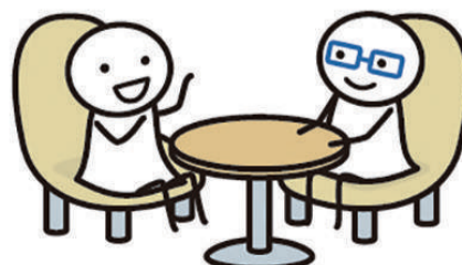
堺市こころの健康推進キャラクター さかいこころちゃん