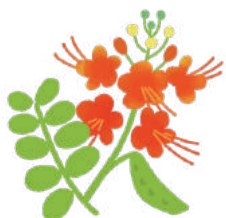
オオゴチョウ (花言葉：自分らしく)

僕は、「自分らしさ」を出したことで、前より、もっと楽しく幸せに過ごしている。そして、今まで接したことがなかった人と友達になるきっかけにもなった。「自分らしく生きる」ことは、自分を進化させると感じた。