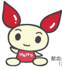
献血推進キャラクター けんけつちゃん