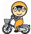
さかいコミュニティサイクルマスコットキャラクター

現在6カ所で共用自転車の有料貸し出しを行っている、さかいコミュニティサイクルのサイクルポート(専用駐輪場)を、4月1日から新たに中百舌鳥駅前(休憩コーナー)に新設するのには、ゲート式の有人サイクルポートです。 なお、利用には利用者本人による登録申請が必要です。定期利用の申請を次のとおり受け付けます。 〓受付開始日〓3月26日(水) 〓受付時間〓午前9時〜午後6時(4月からは午前7時〜午後8時)