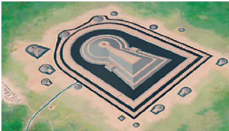
百舌鳥古墳群シアターの上映作品より