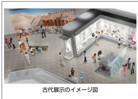
古代展示のイメージ図