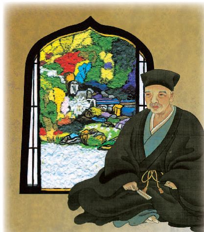
千利休画像(堺市博物館蔵)