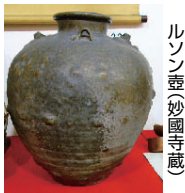
ルソン壺(妙國寺蔵)

詳しくは、市役所市政情報センター、区役所市政情報コーナー、堺東・堺駅・大仙公園観光案内所などにあるパンフレット、堺観光コンベンション協会ホームページ( http://www.sakai-tchoor.jp )をご覧ください。 ☎ 観光推進課 ☎228-7493 FAX228-7342へ。