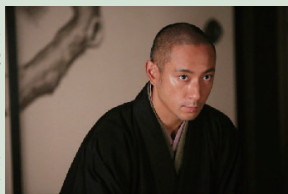
主演の市川海老蔵さん

☎ 同会議所 ☎258-5581 FAX258-5580)が堺フィルムオフィス(観光推進課内 ☎228-3944 FAX228-7342 ☎ http://sakai-film.jp/ )へ。