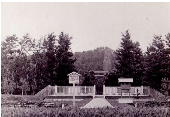
仁徳天皇陵古墳拜所（明治30年代）