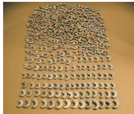
墓山古墳出土勾玉（茨木市教委所蔵）