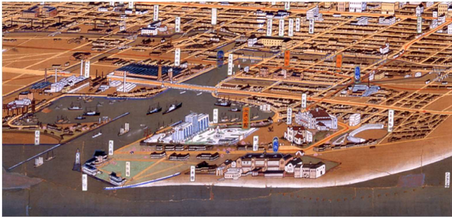
吉田初三郎「堺市鳥瞰図原画」(部分) 1935年