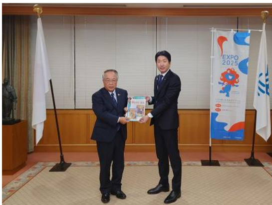
左から寺下組合長、永藤市長