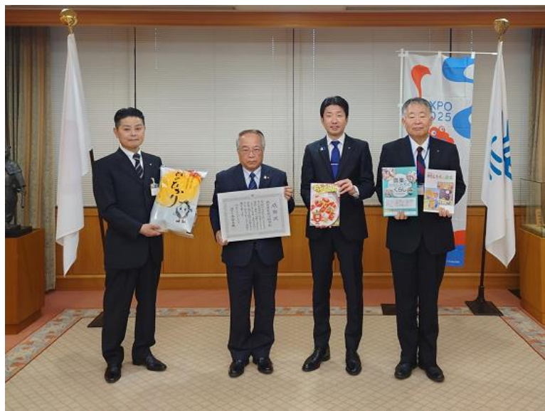
左から井上子ども青少年局長、寺下組合長、永藤市長、長山教育監