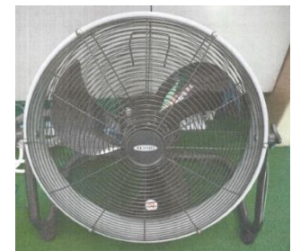
ポータブルファン