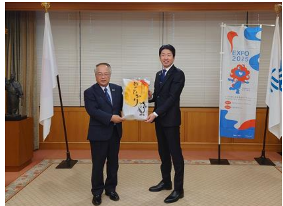
左から寺下組合長、永藤市長