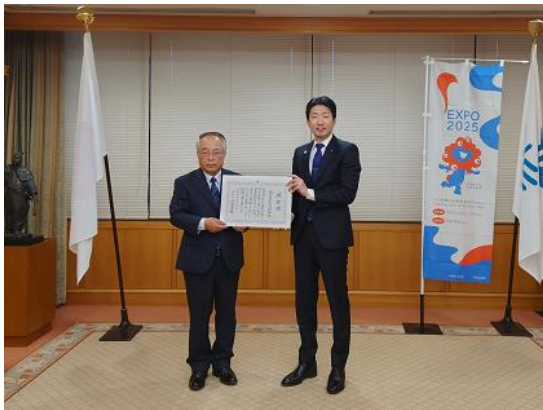
左から寺下組合長、永藤市長