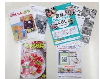
食農教育関連教材 （小冊子・食農教育子ども雑誌）