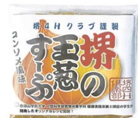
子ども食堂向け食材（堺産ヒノカリ、堺の玉葱スープ）