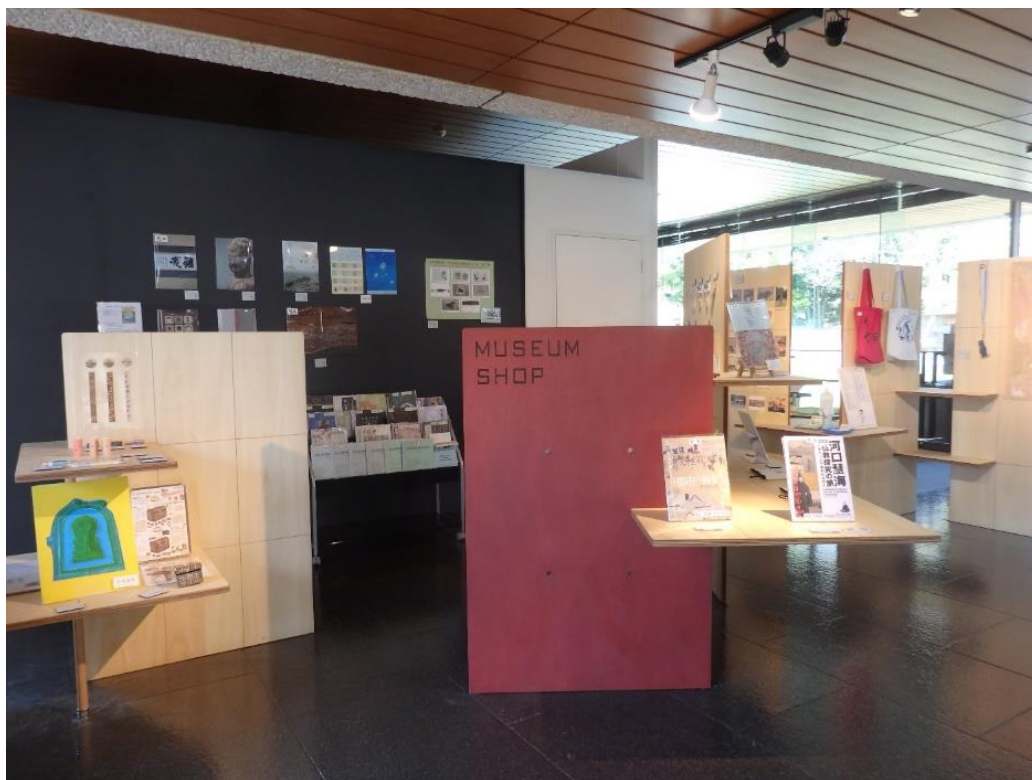
リニューアル後の写真