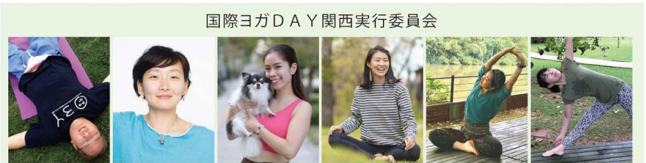
国際ヨガDAY関西実行委員会