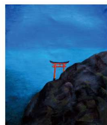
Torii to Heaven