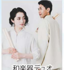
和楽器デュオ 音ノ羽 -otonoha-