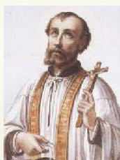
「南インドで布教するフランシスコ・ザビエル」(19世紀のリトグラフ)

インドも堺と同様、お茶の文化が有名です。インド人が好んで飲む「チャイ」は、紅茶を煮出し、ミルクを足してさらに煮出し、大量の砂糖で味付けしたものです。庶民的な飲み物で、道端の屋台で1杯10-20円程度です。