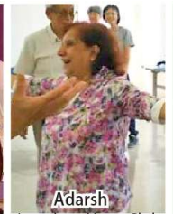
Adarsh Laughter Yoga Club