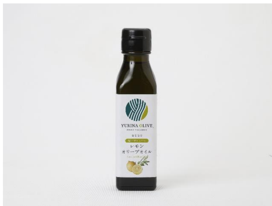
堺産プレミアム レモンオリーブオイル 3名様