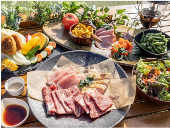
ICOROBA Cafe Terrace プレミアム BBQ プラン ペアチケット 1組2名様

※選出作品の決定時期や景品の贈呈等の詳細については、決まり次第以下の堺市ホームページにてお知らせします。