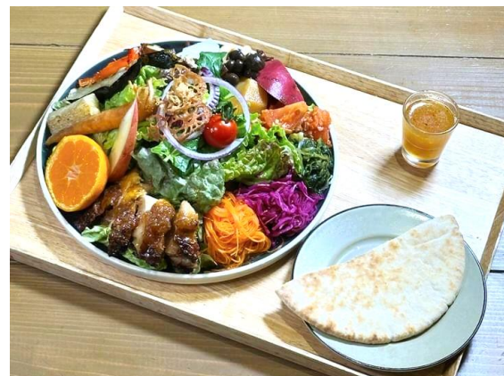
the PARKSIDE サラダプレート ペアチケット 2組4名様