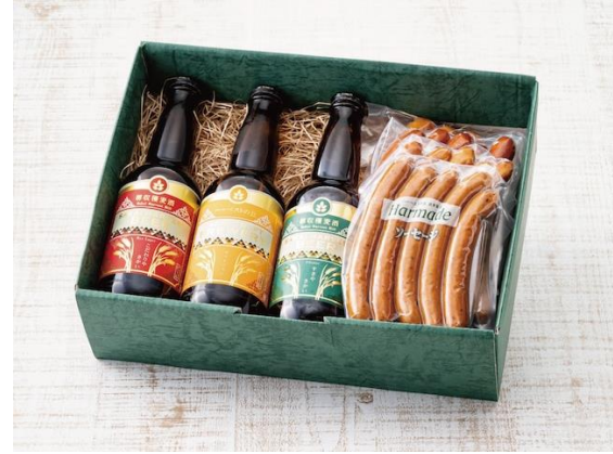
ハーベストの丘いちおしセット 3名様