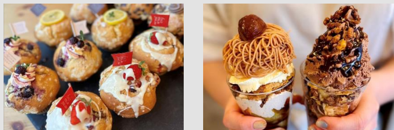
民間の柔軟な発想のもとイベントが可能（例スイーツイベントなど）