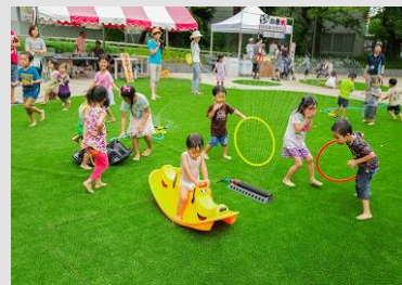
子育て世帯が集い、リラックスする空間 （イメージ）