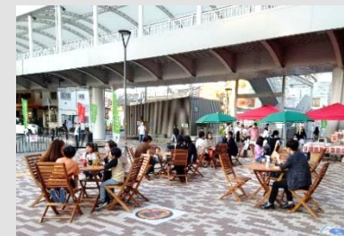
住んでいる・働いている人が憩う空間 （イメージ）