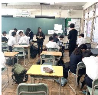
グループワーキングの様子

堺工科高等学校 1 年生のキャリア教育の授業の中で、本年 9 月中旬より株式会社田村商店、さかい SDGs 推進プラットフォーム事務局（堺市）が複数回授業に参加し事業説明などを行いました。以降の授業で 1 年生 6 クラス約 200 名の生徒同士が鉄、鋼材の廃材を使った企画アイデアを出し合い、各クラスの班ごとに取りまとめ、約 30 の企画アイデアが提案されました。それらの企画アイデアを同校、同社、事務局の 3 者の賞と 3 者が選ぶグランプリとして合計 4 作品のアイデアを選定しました。