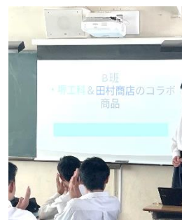
各班企画アイデアの発表の様子